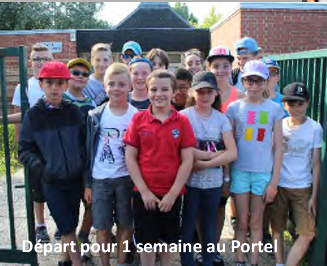
Départ pour 1 semaine au Portel