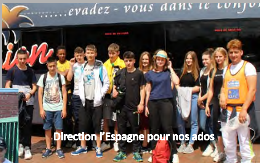
Direction l'Espagne pour nos ados

Vivement les vacances d'automne avec une journée proposée à Plopsaland.